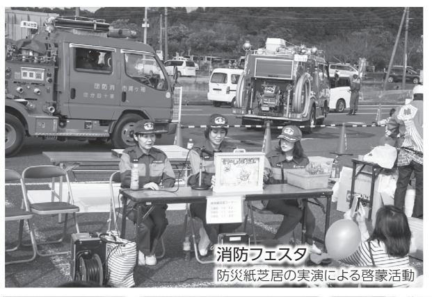
消防フェスタ 防災紙芝居の実演による啓蒙活動