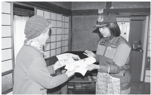
高齢者宅防火診断 高齢者宅を回り、出火危険箇所がないかを点検

◆ 出初め式(1月) ↓ 規律訓練(4月) ↓ 早出し競技会(操法大会)(6月) その他は夏の防災訓練、消防フェスタ、高齢者宅防火診断など、2か月に1回くらい活動している。