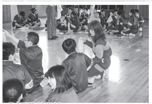
救命講習(中学生) 市内中学校での救命講習の様子