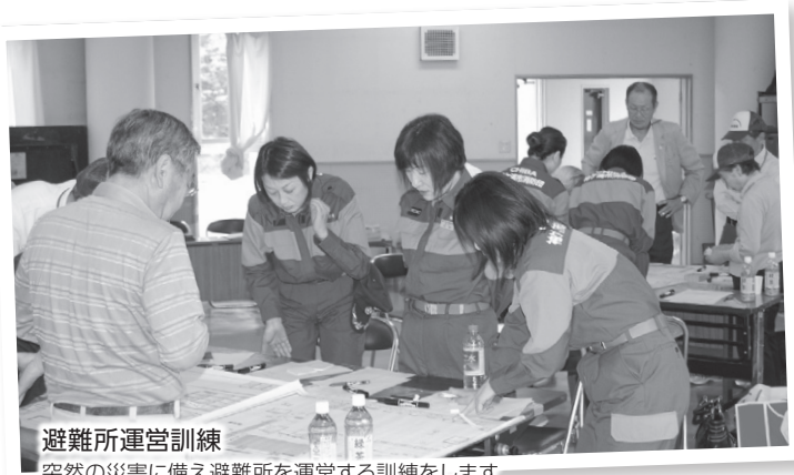
避難所運営訓練 突然の災害に備え避難所を運営する訓練をします